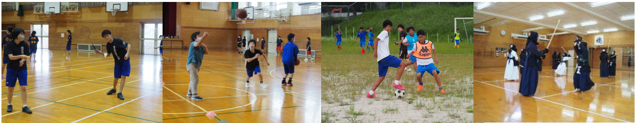
夏休み中の部活動の様子

さて、まだまだ残暑厳しく、夏休み気分が抜けきらない時期ですが、心のやる気スイッチを自分で早く押して、生活のリズムを整えましょう。そのことが2学期の成功の鍵といえます。2学期は、学校祭があります。生徒会や部活動でも中心となって学校を盛り上げていかなければなりません。学級や学年で力を合わせ、一人一人がもてる力を存分に発揮し、全員が活躍できる2学期にしましょう。