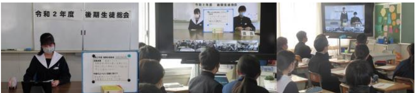
〈オンラインによる生徒総会の様子〉

コロナウイルスの影響で体育館に全校生徒が集まることができないので、オンラインでの生徒総会が行われました。ZOOMを使ってオンラインで会議を行うことも随分慣れてきましたね。これからも幾度となく経験するかもしれません。さて、図書室と各学級をつないだ生徒総会の前半は、執行部と各専門委員会による活動報告が行われ、後半は、校則改正に関する話し合いを行いました。各委員会の活動報告では、どの委員会もコロナウイルスのための制約がある中で、工夫を凝らした活動を行ってくれました。校則改正については今後見直しに取り組んでいく課題について話し合いが行われました。次年度も活発な活動を期待しています。