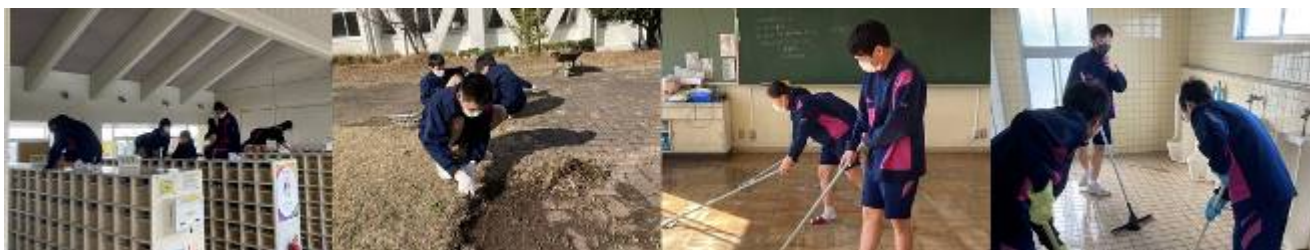
〈3年生愛校作業の様子〉

2月16日(火)に3年生全員で、愛校作業に取り組みました。15日に行く予定でしたが、あいにくの雨模様でしたので、一日遅らせてこの日に行いました。3年間学習や運動に励んできた学校です。それぞれに思いがあることでしょう。みんなで手分けして、日頃できない所を、整備、清掃、修繕をしてくれました。本当にありがとうございます。私は大中を卒業して40年以上たちますが、その当時のままの教室や風景を見ると、不思議と中学生だった時の友人の顔を鮮明に思い出すことができます。古くなった校舎ですが、卒業後も遊びに来てください。