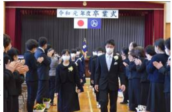
〈昨年度卒業式の様子〉

2月も終わりを迎えようとしています。2月は28日しかないのに、うかうかしているとあっという間に3月になり、やらなければいけないことの期限が急に迫ってきてパニックになることがあります。しかも、今月は27日、28日が土日なので、まだいいやと思っていると週末には3月に突入ということで、少し焦っています。さて、愛知県に出されている緊急事態宣言も今月末でどうやら解除になりそうです。長いこと中止となっていた部活動もようやく再開ができそうです。活動したくてうずうずしていた生徒の皆さんも多いことと思います。日中は春めいて暖かな日も多くなってきましたから、これから大いに部活動を楽しんでほしいと思います。3年生は、もうすでに教科の授業はすべて終了し、3月3日（水）の第74回卒業式に向けてまっしぐらです。ぜひ、残りわずかなクラスでの生活を大切に胸に刻んでいってください。そして、まだ受験が残っている3年生の皆さんは、体調に気をつけて実力を発揮できるように準備をしておいてください。令和2年度は厳しい1年間でしたが、コロナウイルスの感染者が減少してきており、ワクチン接種も始まるなど明るい兆しが見えてきています。気を抜いてはいけません。来年度の新たな幕開けに大いに期待して、今を大切に生活していきたいと思います。1、2年生の皆さんは今年も卒業式に参列して先輩たちの晴れ姿を見ることはできません。とても残念なことです。先輩たちのために、心を込めて前日の準備などを行ってくれることを期待しています。