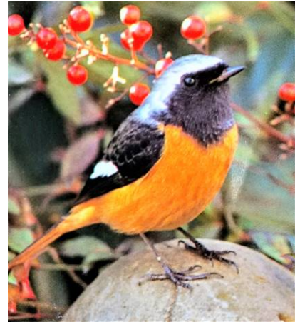
＜ジョウビタキの雄＞ （野鳥ポケット図鑑より）

第3回定期テストも終わり12月となりました。暦の上では11月7日に立冬となり、冬に入っているのですが、暖かい日が続いたので冬のような実感がありませんでした。ようやくこのところ朝晩の寒さで冬が来たなあと感じるようになりました。登校してくる生徒の服装も冬服に代わり、中には手袋やマフラー、黒タイツ姿の女子生徒も多くなってきました。それでも朝の陽ざしは暖かく、昇降口であいさつしていてもコートが必要と感じることはまだありません。そんな日々の中で、冬を感じる事がいくつかあります。毎年、校長室にある洋ランの仲間は、14℃以下の気温に2週間ほどさらし、室内に入れて暖かくするとどんどん花芽を伸ばし始めます。ちょうど今の時期、花芽をどんどん伸ばします。後どれくらいで咲き出すでしょうか。先日学校内を歩いている時に、冬になると渡ってくるジョウビタキという鳥を見かけました。とてもきれいな鳥で、私のお気に入りの一つです。また、夜になると東の空にはおうし座、ぎょしゃ座、オリオン座が昇って来ます。明るい星が多いのも冬の星座の特徴です。今年は火星が赤い光を放って南の高い空に輝いていますので、外に出て少しの時間眺めるだけでとても冬を感じることができますよ。私の娘は結婚して沖縄に住んでいますが、今でも半袖で生活しているそうです。（大中でも半袖カッターの生徒もいますが・・・）せっかく四季のある愛知県に住んでいるのですから、冬を感じて楽しんでください。