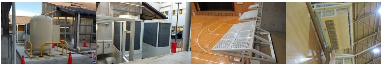
＜体育館・武道場エアコン設置工事の様子＞

この時期に大府中学校では様々な工事が進んでいます。老朽化が進んだグラウンドの夜間照明の撤去工事とクラブハウスの外壁塗装塗り替え工事。通級教室改修工事などが同時に進行しています。新しくきれいになった施設で活動するのが楽しみです。大府市では、すでに全教室と特別教室の一部にエアコンを設置してくれていますが、さらに今年度中に体育館と武道