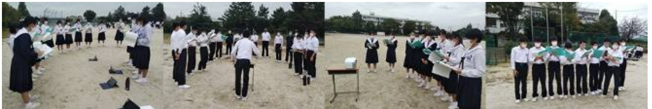
＜屋外での練習風景＞