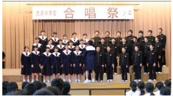
＜昨年度合唱祭の様子＞

大中フェスタが工夫を凝らして行われたのが随分前のように感じます。その後の第2回定期テストも終わり、11月6日（金）の合唱祭に向けて全校で練習に励んでいます。合唱祭もコロナウイルスの感染予防のため、本来のような練習はできません。特に合唱は飛沫が多く飛散するため、教室内で多くの生徒が合唱することができません。なので、パートに分かれて教室と特別教室を中心に練習しています。屋外も各組に割り振って安全に配慮して練習しています。例年ならば、あちらこちらで、クラスまとまった歌声を聞くことができるのですが、なかなか全員での合唱はできないのが現状です。マスクをしたままの歌唱も思うように声が出ず、また呼吸にも負担がかかります。このような状況の中でも生徒たちが一生懸命に練習している姿と歌声は、私の心に沁み込んできます。当日は学年ごとの開催となり、他学年の歌声を聞けないのが残念ですが、後日録画・録音したものを視聴してもらいます。3年生の歌声のすばらしさをぜひ味わってください。保護者の皆様には大中フェスタ同様に、お子様の素晴らしい歌声を聞いていただくことができず残念に思います。コロナウイルス感染予防のためご理解のほどお願いします。