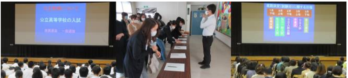
＜進路説明会・進学説明会の様子＞

10月23日(金)5,6時間目に3年生進路説明会と保護者向けの進学説明会を行いました。今までは親子で一緒に説明を聞いていたのですが、コロナウイルス感染予防の関係で、生徒と保護者の方は別々に行いました。11月あたりからは自分の進路を決定していく時期になります。進路決定に際しては、自分の将来の夢や希望だけではなく、金銭面や通学時間、成績等いろいろな要素があります。ですから、親子でしっかり話し合い、自分の適性に合った進路先で充実した生活を送ることができるようにしていきましょう。3年生の先生たちはいろいろな情報を持っていますので、気軽に相談してください。