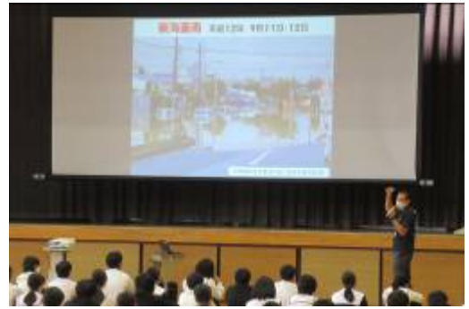
＜2年生防災講演会の様子＞

10月22日(木)6時間目に、2年生対象の防災講演会を行いました。毎年行っている講演会ですが、今年はレスキューストックヤードの方がコロナウイルス感染予防のため来られないので、大府市の危機管理課の方をお招きして、水害や地震についての知識や必要な備えについてお話いただきました。今年は幸いなことに台風接近もなく、水害については無事に1年が過ぎていきそうです。過去には大府市も水害で大変な被害を受けたこともありますし、いつ来るかわからない地震に対しても備えておく必要があります。今は情報がすぐに伝わるようになってきましたので、その時にどう対応できるかが自分の命や財産を守ることにつながることでしょう。正しい知識を持つことで、正しい判断が行えるよう普段から心がけていきましょう。