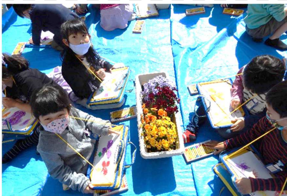
春の花の絵をかいだよ。

19日（月）から、子どもたちだけの下校が始まります。自分で安全に下校ができるよう、今一度、下校経路の確認をお子さんとしてください。