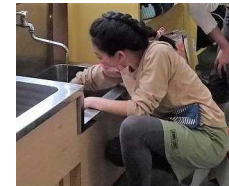
もくもく清掃の様子