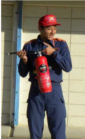
消防士さんから丁寧に教えていただきました。